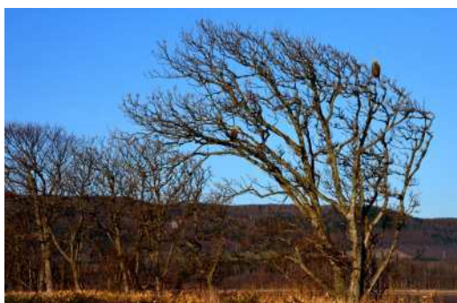
今回は紋別市のコムケ湖で観察します