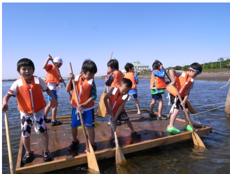
気持ちを合わせて漕ごう！