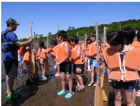
説明を聞いて、いよいよ出発！

ネイパル北見で最も人気の高い活動であるカヌーやいかだ体験で楽しんでみませんか。仲間や家族と声や力を合わせて、サロマ湖に漕ぎ出しましょう。