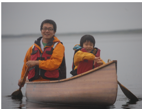
親子で楽しいひとときを