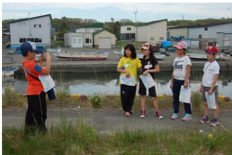
チェックポイント発見！