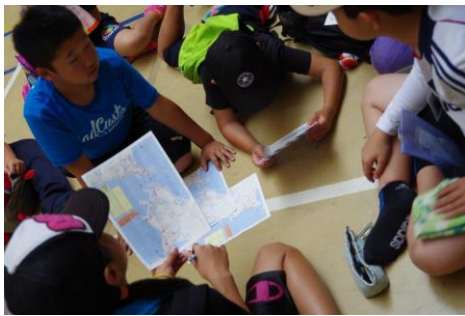
友達と相談して探すことが重要

仲間と相談し、地図に記載された写真の場所を探す活動です。体力や戦略、チームワークが求められ、コミュニケーション力を高めることもできます。