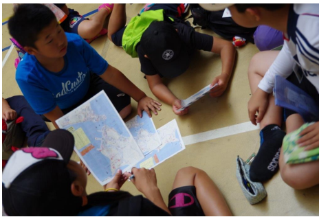
友達と相談して探すことが重要

仲間と相談し、地図に記載された写真の場所を探す活動です。体力や戦略、コミュニケーション能力などが求められ、チームワークを高めることができます。