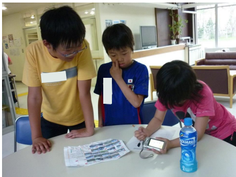
見つけたものを交流しよう