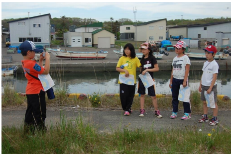
チェックポイント発見！