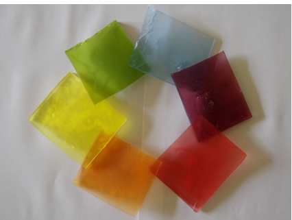
色の3原色から、様々な宝石が出来上がる！