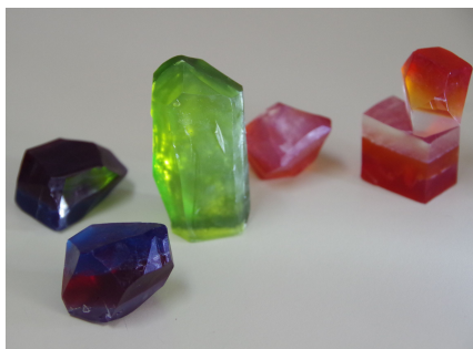
世界にひとつの宝石石けん！

グリセリンソープを使った宝石石けんです。自分で作ったキラキラした石けんは、手洗い（うがい）をより楽しませてくれます。