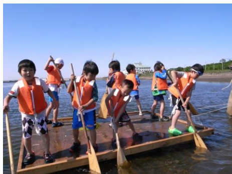
気持ちを合わせて漕ごう！