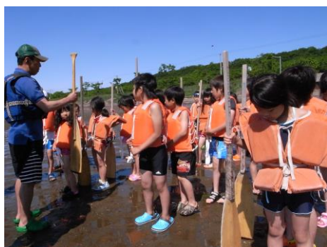
説明を聞いて、いよいよ出発！

ネイパル北見で最も人気の高い活動であるカヌーやいかだ体験で楽しんでみませんか。仲間や家族と声や力を合わせて、サロマ湖に漕ぎ出しましょう。