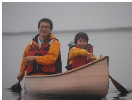
親子で楽しいひとときを