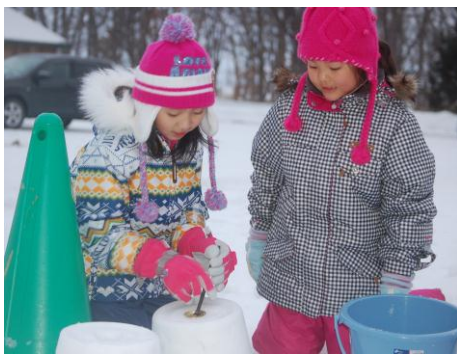
よく固めた後、スチール缶を抜く

雪や氷で作ったランタンにろうそくを入れて、オリジナルキャンドルを作ってみましょう。夜の屋外で灯る幻想的な光の美しさは格別です。