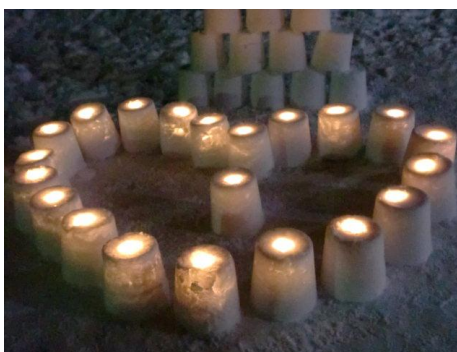
火をつける瞬間は、ドキドキ