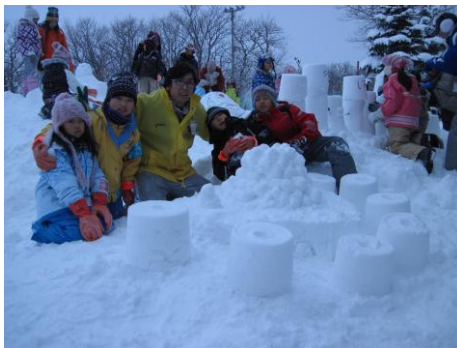
グループで協力して作ろう！