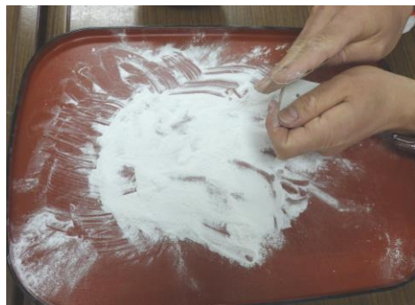
大量の粉が出るため、掃除は入念に