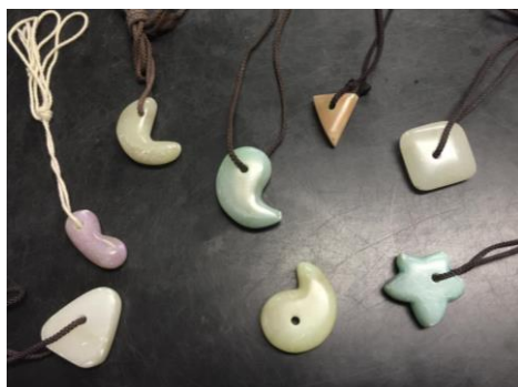
きれいな勾玉が完成！