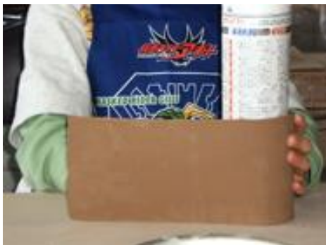
粘土を瓶にまきつけて作っていく