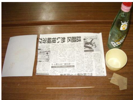
準備する用具（粘土以外）

常呂のホタテ貝を混ぜて作る「流水焼」。外部講師の指導のもと、コーヒーカップを作ります。簡単・綺麗に作る技法なので、小学生にもオススメです。