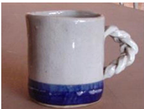
完成品のイメージ