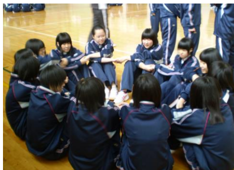
活動をとおして絆を深めよう！