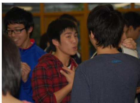
初めて話す人と楽しく自己紹介

児童・生徒がより良い人間関係を築くヒントを得るために行う活動です。事前にねらいや集団の状況などを打合せ、団体に応じた活動内容で実施します。