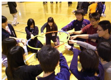
心を合わせて立ち上がろう！