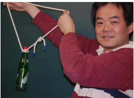
しっかり結べばこんなことも可能