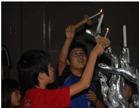
手持ちしよく台でろうそくに点灯