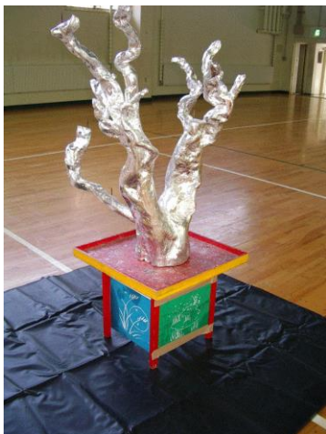
大しよく台の下にはマットを敷く